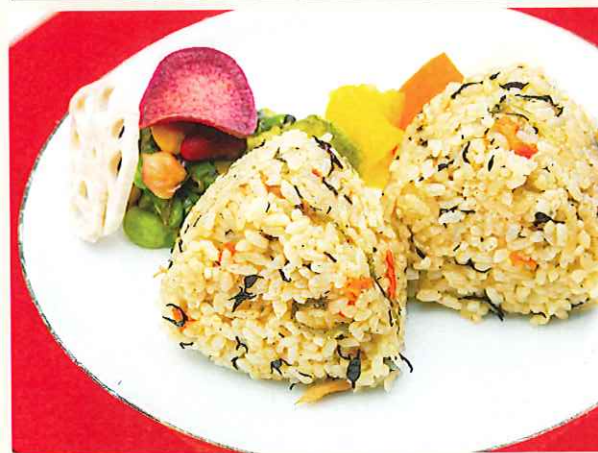
ジューシーおにぎり 自家製漬物と日替わり和え物付 ¥600