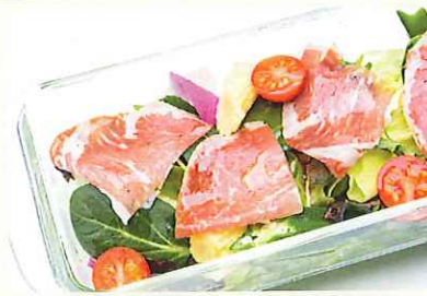
生ハムと彩り野菜の南国サラダ ¥750