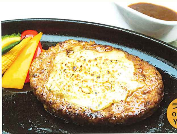
沖縄県産黒毛和牛のチーズハンバーグステーキ ¥1,500