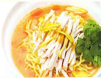
バンバンジー冷麺 (久米島味噌風味) ¥800