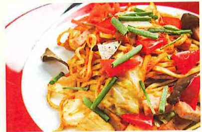
うちなー焼きそば ¥800