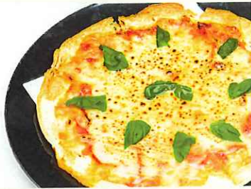
ピッツアマルゲリータ (トマトバジルピザ) ¥1,100