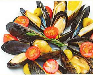
ムール貝の白ワイン蒸し タイムの香り ¥800