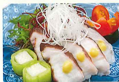
島ダコ酢味噌がけ ¥750