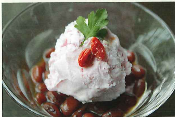
沖縄ぜんざい (アイスは日替わりとなります)