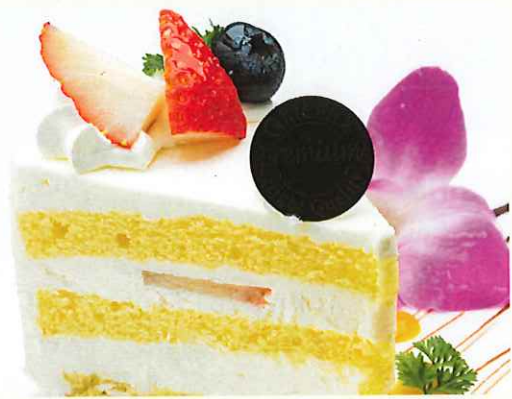
日替りデザート (スタッフにお尋ねください)