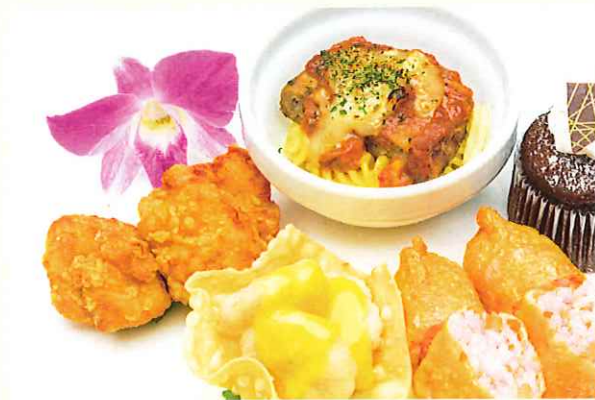
キッズプレート ミートローフとチーズの pasta グラタン から揚げ 海老マヨネーズ いなり寿司 デザート