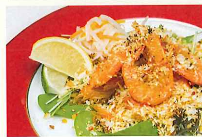
フーチバースパイシーシュリンプ ¥900