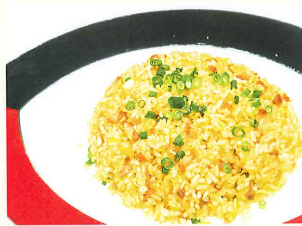
かりゆし特製炒飯 ¥900