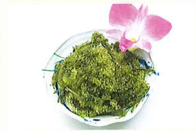
海ぶどう (50g) シークワサードレッシング添え ¥800