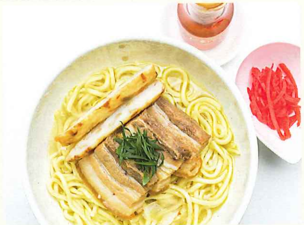
かりゆし沖縄そば ¥950