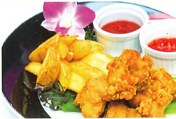
かりゆし風チキンから揚げ&ポテトフライ ¥800