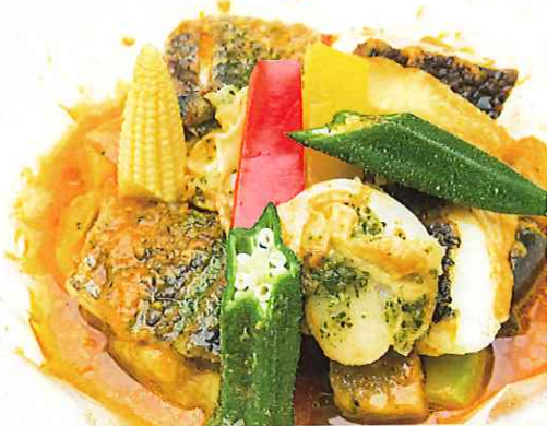
近海魚とホタテの包み焼き プロバンス風 ¥950