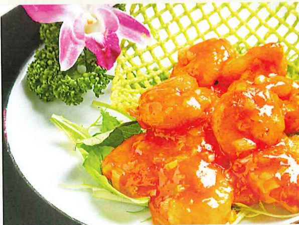
海老のチリソース ¥1,000