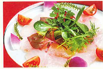
美ら海鮮魚のカルパッチョ ¥750