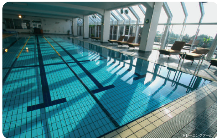
トレーニングプール